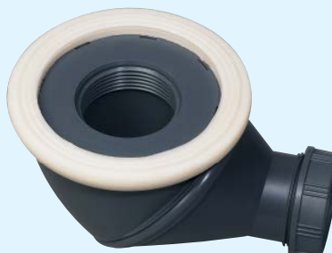
Receveur < 6 mm