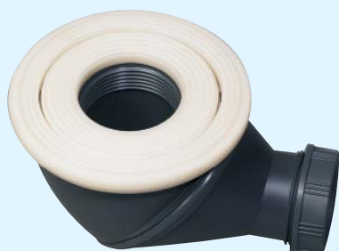
Receveur > 6 mm