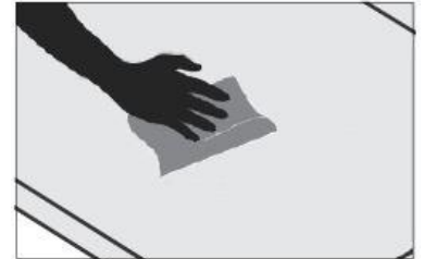
3 - Assurez-vous que la surface soit sèche et sans eau.