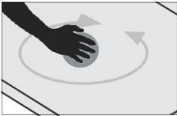
1 - Poncer manuellement la surface du bac à douche à l'aide d'un disque abrasif.

Attention, avant d'effectuer la réparation, bien s'assurer que la zone endommagée est sèche et sans poussière .