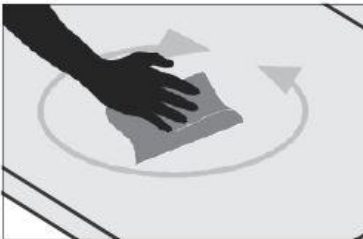
4 - Dégraisser avec de l'acétone à l'aide d'un chiffon ou d'un essuie-tout la surface poncée.